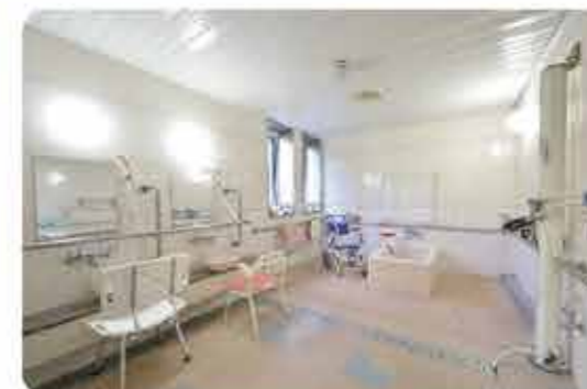
介助しやすい広い洗い場が特徴のお風呂