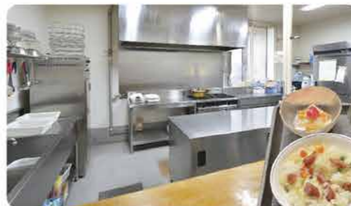
業務用ガス厨房で美味しい食事を提供