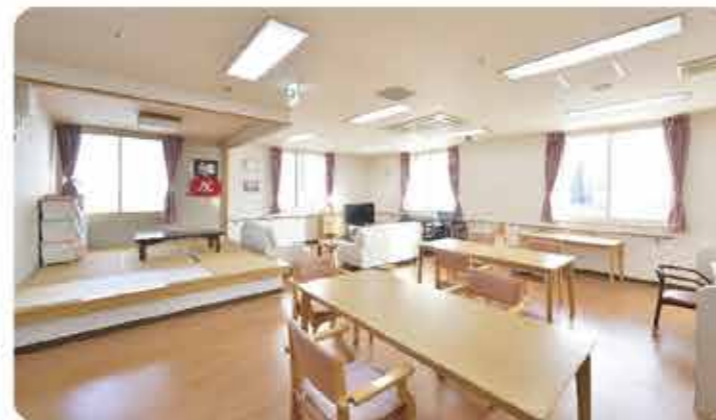
陽の光が差し込む明るく広いホール