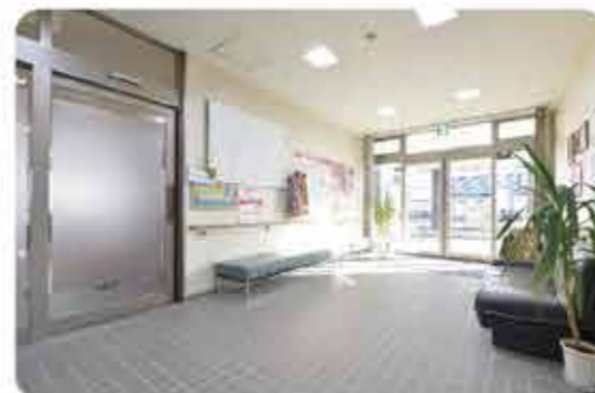
行き来しやすい両棟を結ぶ玄関ホール