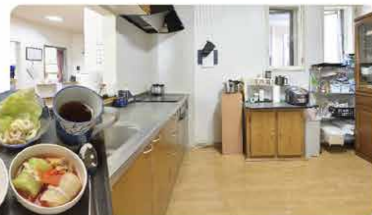
入居者にも安心なオール電化キッチン