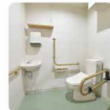
すべてのトイレに手すり完備