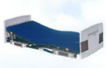
【介護ベッド】 ご入居者が安楽に乗降できる ように、全室に設置しております

【事業所番号】0170200802 【入居定員】18名（1ユニット9名×2ユニット）【居室部分】18室（全個室）居室面積：9.94㎡ 設備：介護ベッド・照明器具・クローゼット・防煙、防火カーテン・暖房設備【共有部分】居間2・食堂2・台所2・浴室2・トイレ6・洗面所6・洗濯室2・地域交流室1【構造・規模】木造2階建て【敷地面積】923.2㎡（279.76坪）【建築面積】307.4㎡（93.15坪）【延床面積】571.0㎡（173.03坪）