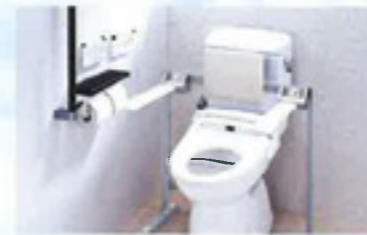
【トイレ】 両側に手すりを設置して、安楽 にお使いできます