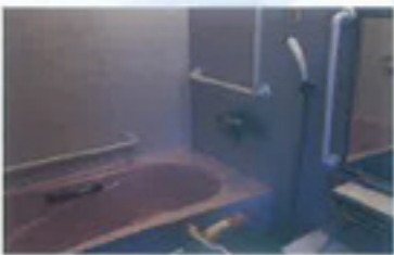
【浴室】 安全を最優先に、各所に手すり を配置しております