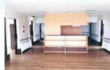
【食堂】 両側に居室を配置して見渡しが 行き届くよう、安全に配慮して おります