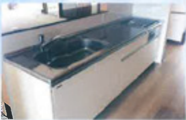
【キッチン】 ご入居者の方と一緒に調理が できるよう、IHヒーターを使用 しております