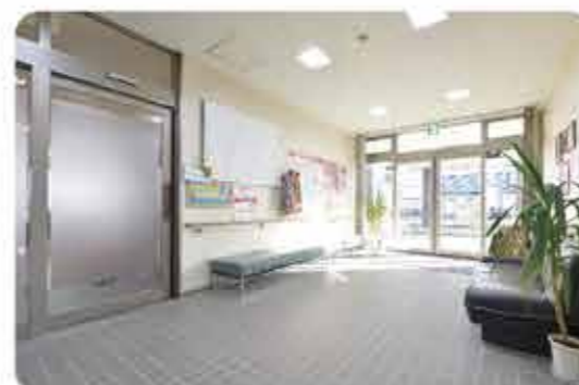
行き来しやすい両棟を結ぶ玄関ホール