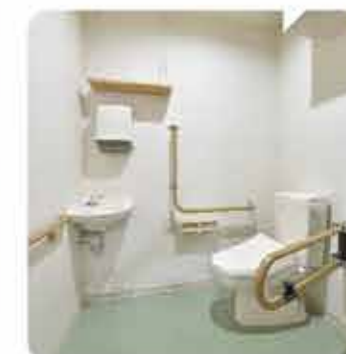
すべてのトイレに手すり完備