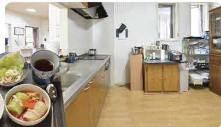
入居者にも安心なオール電化キッチン