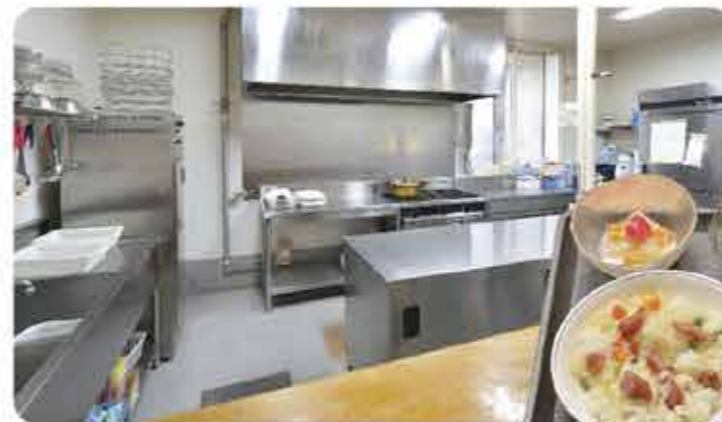
業務用ガス厨房で美味しい食事を提供