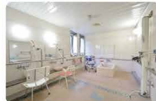
介助しやすい広い洗い場が特徴のお風呂