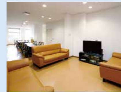
ディサービスルームかもめ